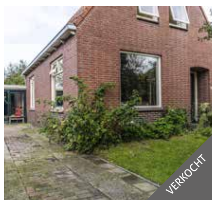
Venneweg 47, Veelerveen