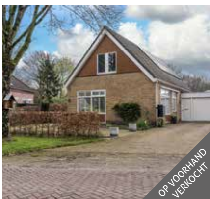
Hoofdweg 214, Bellingwolde