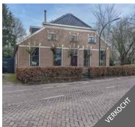
Hoofdweg 179, Bellingwolde