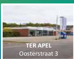
TER APEL Oosterstraat 3

Voor meer informatie: tel: 0599 65 13 13 – www.wedekakingloop.nl