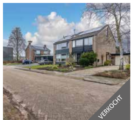
Bilderdijkstraat 6, Winschoten