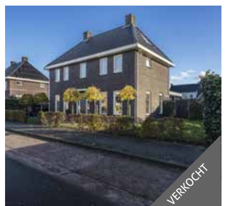
Refter 1, Winschoten