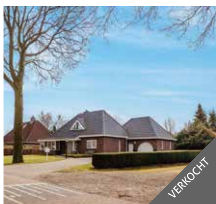
Sportweg 62, Bellingwolde