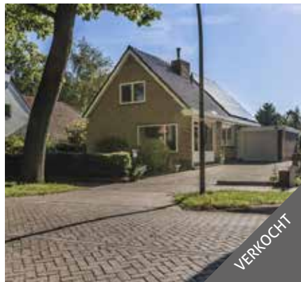
Hoofdweg 294, Bellingwolde