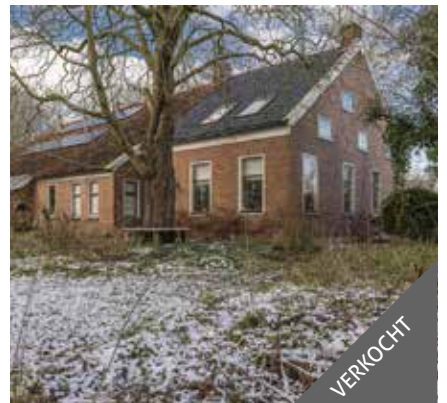
Ekamperweg 3, Oostwold