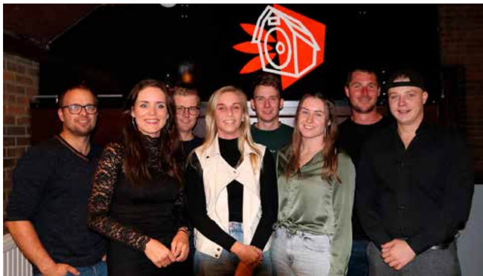
De activiteitencommissie van Jeugdsoos De Boerderij.