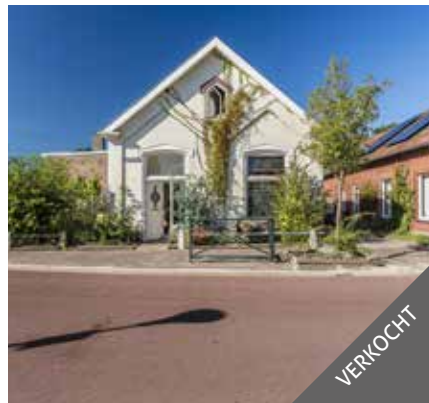
Hoofdstraat 32, Oostwold