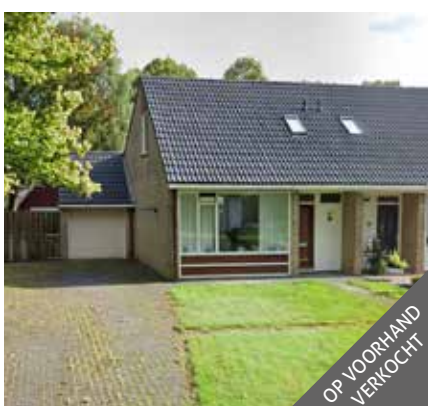
Groene kruislaan 22, Bellingwolde