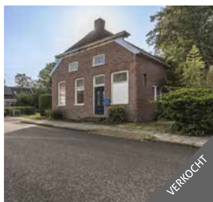
Hoofdweg 51, Finsterwolde