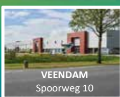
VEENDAM Spoorweg 10