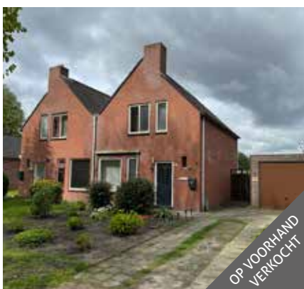
Oostersingel 21, Bellingwolde