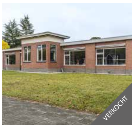
Wedderweg 1, Vriescheloo