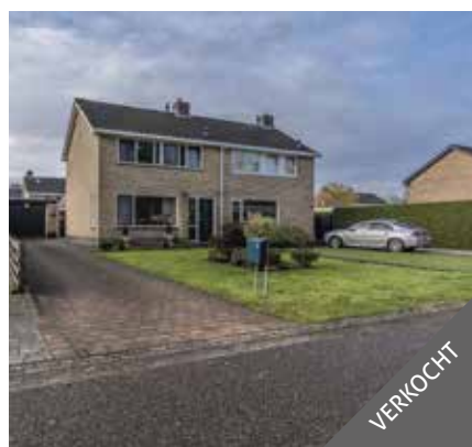
De Klieve 29, Bellingwolde