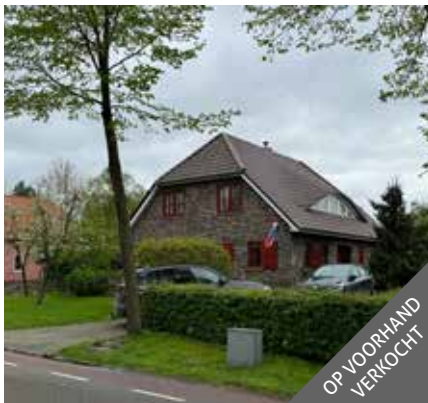
Loosterweg 7a, Veelerveen

Neem dan vrijblijvend contact op met ons kantoor.