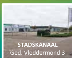
STADSKANAAL Ged. Vleddermond 3

Bespaar uzelf veel tijd, werk en moeite! Wij halen gratis spullen bij u op voor hergebruik