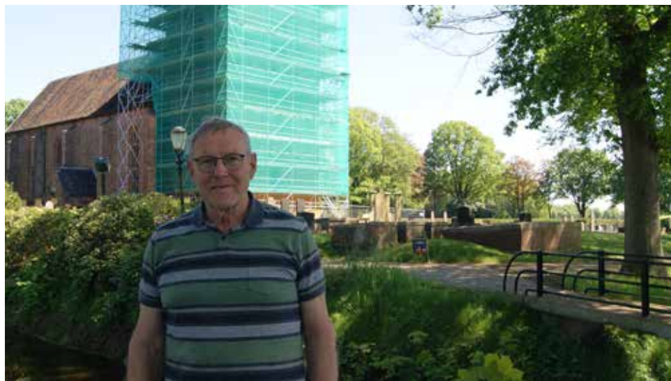
Bellingwolde, Blijham, Onstwedde, Vlagtwedde, Vriescheloo en Wedde