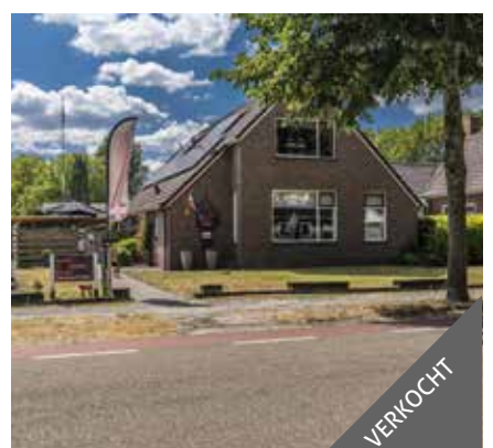
Industrieweg 24, Vriescheloo